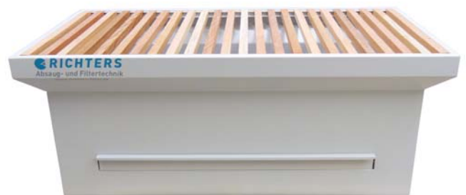
ATO ohne Rück- und Seitenwände Tischauflage aus Hartholz