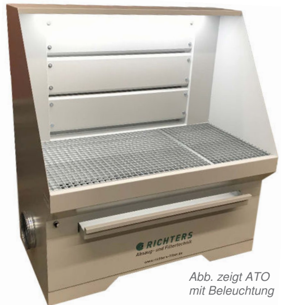
Abb. zeigt ATO mit Beleuchtung

Auf beiden Seiten befindet sich ein Absaugstutzen, es wird jedoch nur ein Stutzen benötigt. Die andere Seite ist mit einem Blinddeckel verschlossen. – So können die ATO-Absaugtische den Gegebenheiten vor Ort angepasst werden.