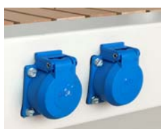
2 Stück 230-Volt-Steckdosen